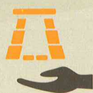
Cuidado del patrimonio