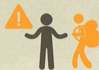
Cuidar al turista