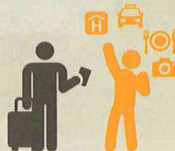
Orientación al turista